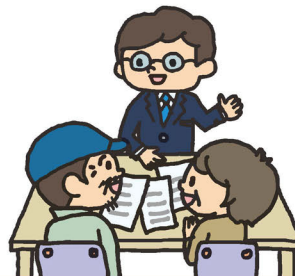
サポセン (なら担い手・農地サポートセンター)