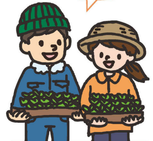
農地を借りたい人