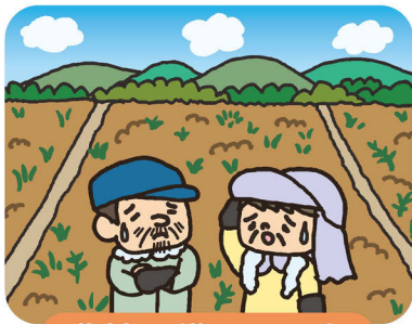
農地を貸したい人